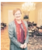
Konferenssin virallisena suojelijana toimii Tasavallan Presidentti Tarja Halonen.

The President of the Republic of Finland Tarja Halonen is the official patron of the Conference.